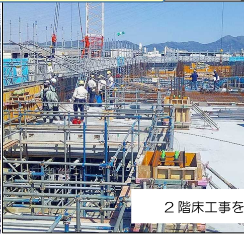
2階床工事を始めています